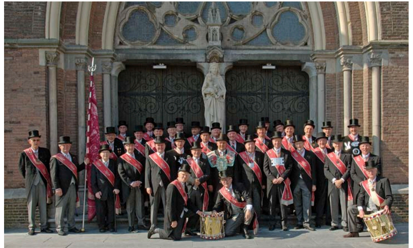
Boven: Nagenoeg alle leden van het Sint-Catharinagilde Eindhoven-Stad voor de Cathrien. Onder: Oudst bekende vermelding van het Catharinagilde in de Burgemeestersrekening van 1437.

zijn lid voor het leven en gaan een bepaalde verplichting ten opzichte van elkaar aan. Of, zoals De Haan het verwoordt: „Het is een roeping. Wij delen iets hogers. Het is heel bijzonder om samen met 1.500 gildebroeders tijdens de kringgildedag op te marcheren. Dat gevoel kan ik niet omschrijven.”