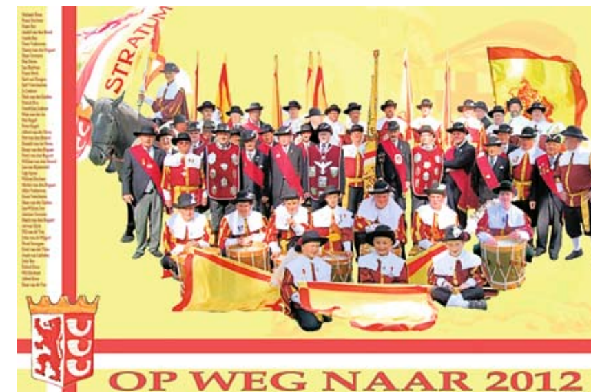
Poster van het Stratumse Sint-Jorisgilde ter gelegenheid van het 500-jarig jubileum.

Er rest maar één ding: hup, die barricaden op! Alhoewel ik volgens De Haan van het Catharinagilde weinig gezelschap zal krijgen... 🚩