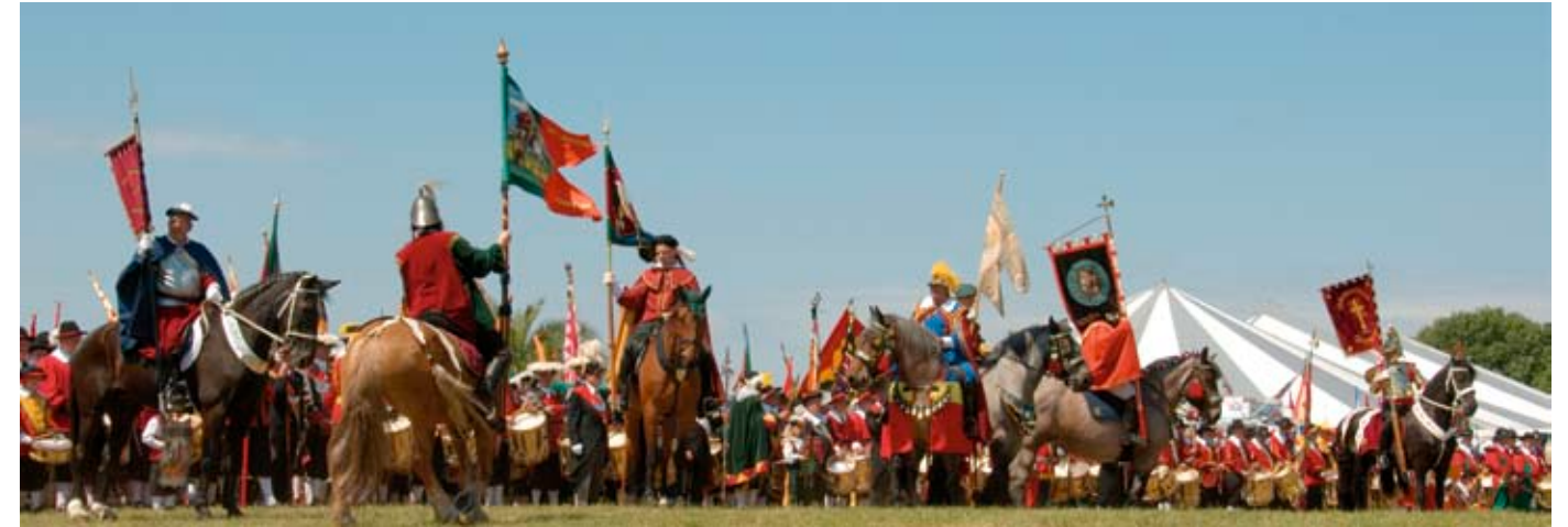
Vaandeldragers gaan de opmars van de gildes voor tijdens de Kringgildedag van 2011 in Riethoven.

onderuit als we willen overleven. Gelukkig hebben we een hele goeie tamboergroep met zeven jonkies die nog wel eens iets nieuws organiseren, zoals een darttoernooi. Ook het initiatief voor het led-verlichte vendel kwam van iemand uit deze groep.”